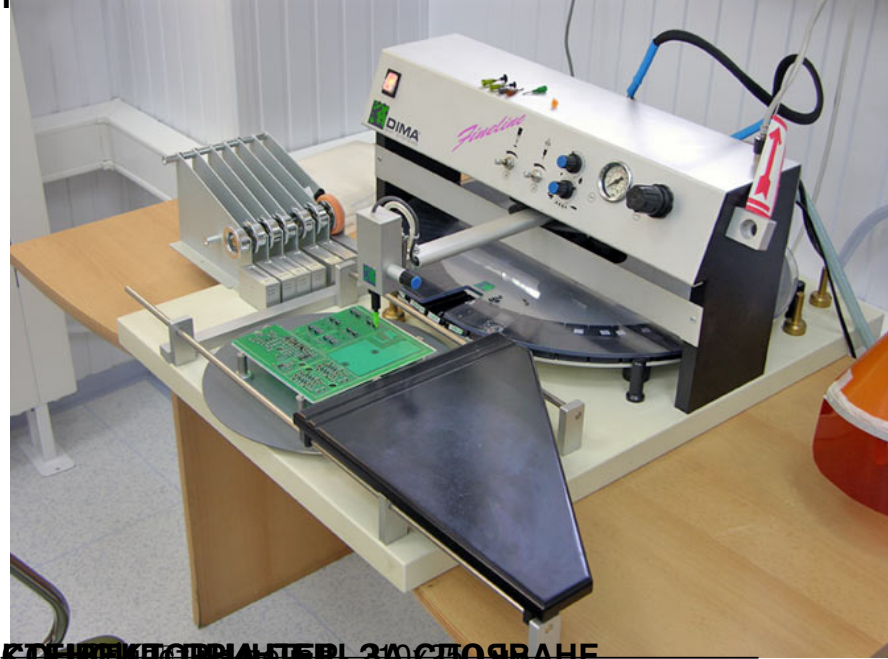
СЪБИРАТЕЛНА МАШИНА ЗА СЪБИРАНЕ